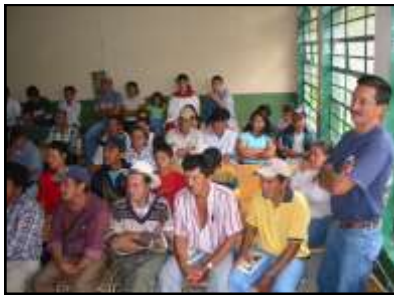
La comunicación fue una de las principales situaciones evidenciadas en el autodiagnóstico de la montaña

Recuperar el patrimonio cultural campesino e Implementación de la Semana Campesina.