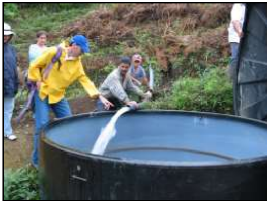
Sistemas de almacenamiento y distribución de agua para consumo y