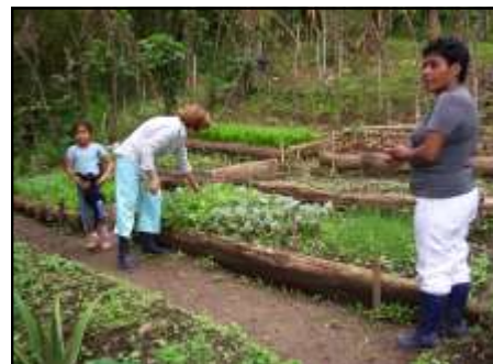
La finca campesina como productora de alimentos para la familia