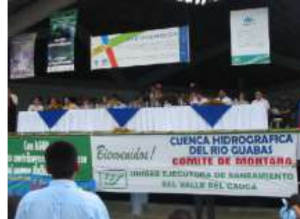
Lanzamiento del Comité de Montaña en la Agenda del agua