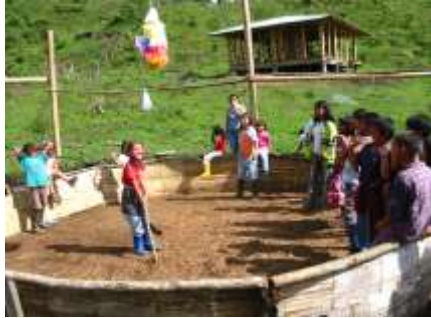
Conservación de tradiciones y cultura campesina