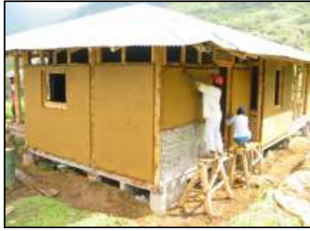
Vivienda digna y en armonía con la naturaleza