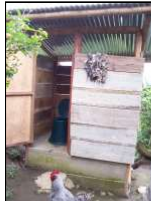
La letrina seca ma- nejo integral del agua