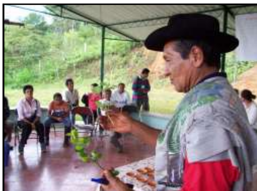
Intercambio de saberes en salud tradicionales entre generaciones