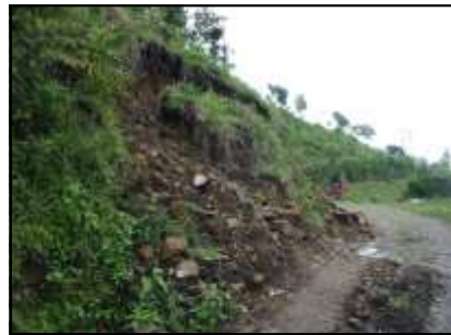
Estado de las vías en la montaña