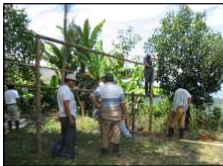
Promoción de la minga como expresión solidaria