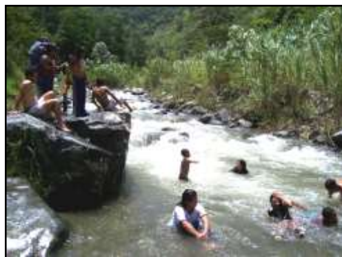
Nuestro río Guabas como sitio de sana recreación