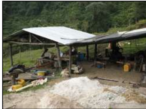
Explotación minera en el territorio