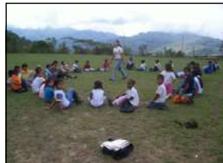
La recreación y convivencia como pilares de una formación sostenible