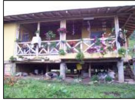
La familia campesina y su arquitectura de montaña